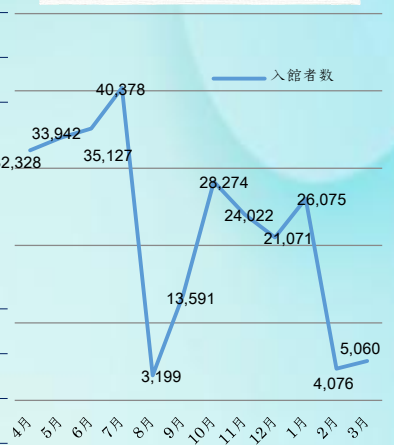
2017年度 月列入館者数 (人)